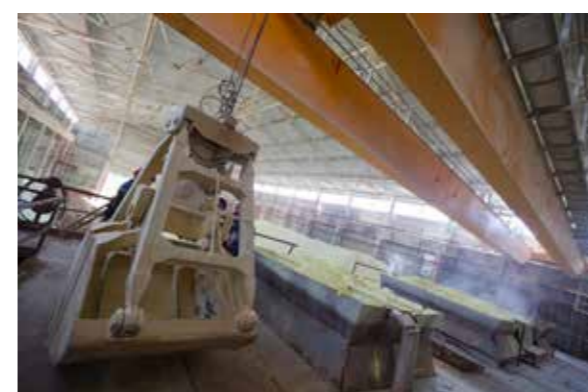
Мостовой грейферный кран грузоподъемностью 5т для перегрузки серы (заказчик ОАО «ГродноАзот»)