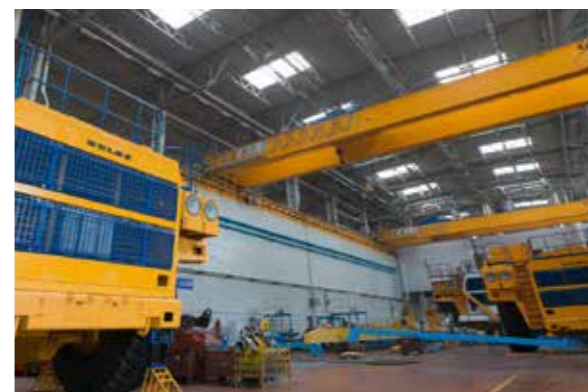
12 мостовых кранов грузоподъемностью до 50т (заказчик ОАО БЕЛАЗ)