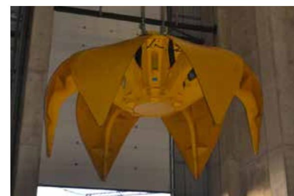
Автоматические грейферные краны для биоэлектростанции по сжиганию деревянной стружки (заказчик АО «Lietuvos Energija»)