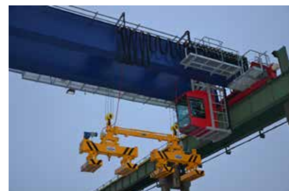
Семь кранов с магнитами для разгрузки листового и профильного металла (заказчик AS «BLRT group»)